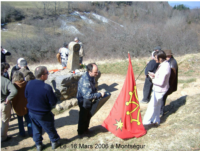
Le 16 Mars 2006 à Montségur

Pour moi, pas de doute, l'Eglise de Rome, en bonne 'fille', le Pape et le roi de France en bons princes et suppôts de Satan se sont rendus coupables du plus abominable des crimes contre l'humanité, l'extermination au nom du Christ de leurs frères et sœurs les meilleurs parmi eux et la chrétienté.